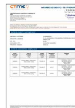
ENSAYOS DE ADHERENCIA Recubrimiento de lacado