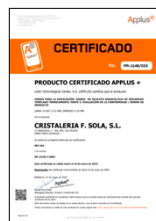
EN 12150-2:2004 Vidrio para la edificación