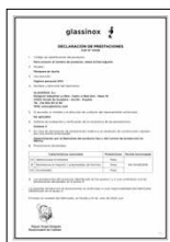
UNE-EN 14428:2016 Mamparas de baño