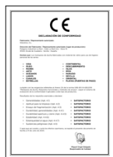
UNE-EN 14428:2016 Mamparas de baño