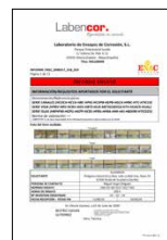
ENSAYOS DE CORROSIÓN Piezas metálicas