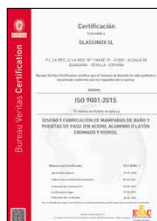
ISO 9001:2015 Sistema de gestión de la calidad